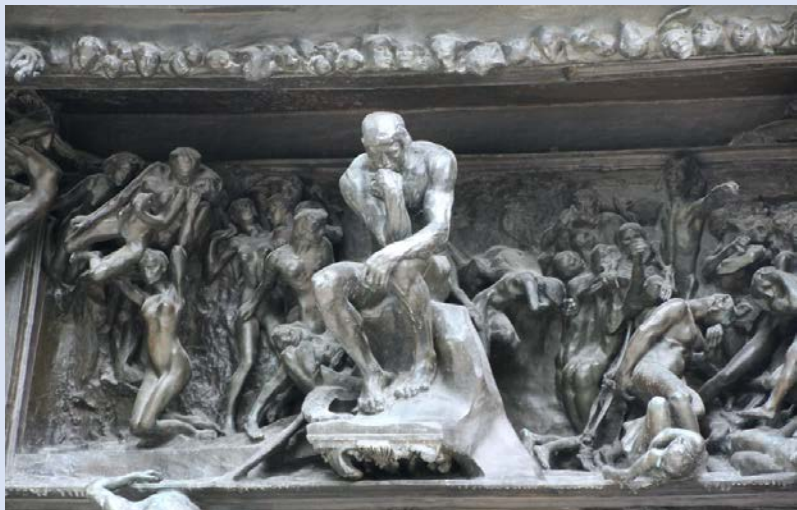
Այլևս մեղք չգործել

Մեղքերի բարձրաձայն խոստովանությունն ունի նաև հոգեբանական բուժիչ, վերականգնողական նշանակություն: Նույնիսկ հոգեբանները, մանավանդ, հոգեվերլուծության ֆրեյդյան դպրոցը վաղուց կիրառում է մի մեթոդ, որով ջանում են օգնել հիվանդին հաղթահարել հոգեկան ցավը՝ այդ ցավի մասին բարձրաձայն խոսելով, վերարթնացնելով անցյալի հիշողությունները, կամ գիտակցական մակարդակ հանելով անգիտակցական ոլորտում հայտնված վերքերը, որոնք կարող են հաճախ մարդկային վարքի շեղումների, նաև մեղքերի առիթ դառնալ: Եվ հետո, խոստովանության դեպքում ցավի մասին բարձրաձայնելով՝ մարդն այդ ցավի բեռը դնում է Քրիստոսի՝ ամենահոգատար հոգեբանի ուսերին՝ քահանայի միջոցով: Քրիստոս մեր ցավը կրում է իր վրա, «նա մեր ցավերը կրեց», Ես. 53, 4: Այս է պատճառը, որ մեղքերը խոստովանելուց հետո արտասովոր խաղաղություն է իջնում մեր հոգիներին՝ Քրիստոսի այն խաղաղությունը, որ այս աշխարհը չի կարող երբեք տալ, սա մեղքի հանդեպ հաղթանակի զգացումից ծնված խաղաղությունն է, ճակատամարտում Տիրոջ զրությամբ հաղթելու զգացումից ծնված խաղաղությունն է: Աղոթենք, որ Քրիստոսի հետ միասին մի օր հաղթենք նաև հոգևոր պատերազմը. Ամեն: