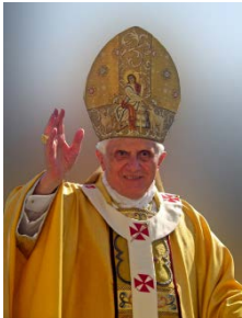
Բենեդիկտոս 16-րդ, խոսք՝ Իտալական Կարիտասին, 2011թ. Insegnamenti VII, 2, [2011], 776

Դրանք հավատքի՛ց մղված գործեր են: Դրանք Եկեղեցու՛ գործերն են՝ ամենակարիքավորների հանդեպ Եկեղեցու ուշադրության արտահայտությունը»: