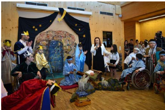
2019թ. դեկտեմբերի 20-ին Հայկական Կարիտասի «Էմիլի Արեգակ» բազմակի

«Հաշմանդամություն ունեցող անձանց մեջ է՛լ ավելի մեծ ուժգնությամբ է բացահայտվում մարդու արժանապատվությունն ու մեծությունը». Կաթողիկե Եկեղեցու սոցիալական ուսմունքի ամփոփ, 148.