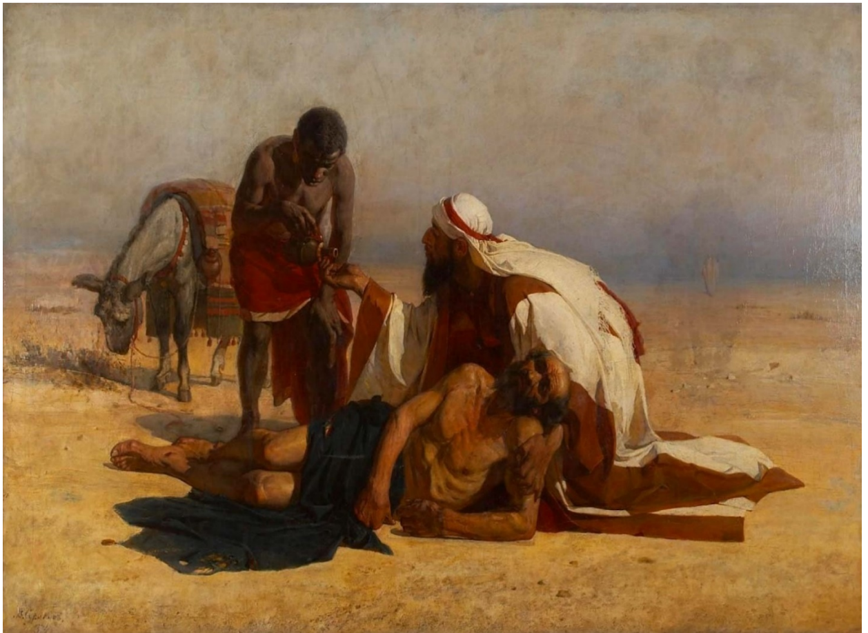
«Բարի սամարացին», Վասիլի Սուրիկով, 1884