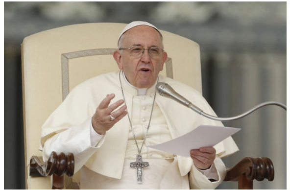
«Աղաչում ենք հանուն Քրիստոսի, որ հաշտվե՛ք Աստծո հետ» (Բ Կոր. 5, 20)

Սիրելի եղբայրներ՛ր եւ քույրեր՛ր, այս տարի եւս Աստված մեզ բարենպաստ ժամանակ է պարգևելու, որպեսզի մենք մաքրված, նորոգված սրտով կարողանանք պատրաստվել տոնին՝ Հիսուս Քրիստոսի մահվան ու Հարության մեծ Խորհրդին, որն քրիստոնեական անձնական եւ համայնքային կյանքի անկյունաքարն է: Այս Խորհրդին մենք պետք է միշտ վերադառնանք եւ՛ մտովի եւ՛ սրտով: Իսկապես, այն չի դադարում մեր մեջ աճել այնքանով, որքանով մենք մասնակցում ենք այդ խորհրդի հոգեւոր զարգացմանը եւ ներգրավվում ենք՝ մեր ազատ ու մեծահոգի պատասխանով: