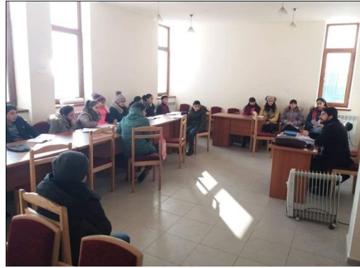
Քրիստոնեականի, անգլերենի, համակարգչային հմտությունների դասեր, դասընթացներ, բեմադրություններ

Նրանք որոշեցին հարմարություններ ապահովել գյուղում միայնակ տարեցներից մեկի տանը՝ ձմռան ցրտից պաշտպանելու համար: Յուղաբեր տատիկն ապրում էր սարսափելի անմխիթար պայմաններում, մի հյուղակի մեջ, որտեղ չկային ամենատարրական պայմաններ, պատուհանները գրեթե բաց էին, քամին ու ձյունը անարգելք ներս էին թափանցում, վառարան չկար, տատիկը ցրտերից պաշտպանվում էր միայն վերմակով ու ծածկոցով: Հիգիենիկ պայմաններից ևս զուրկ էր հյուղակը: Տատիկն ապրում էր իր