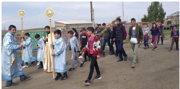
Խաչվերացի տոնին Բավրայի հայ կաթողիկէ երիտասարդական միությունը Ս. Հովսեփ Քին.

Գալստյանի առաջնորդությամբ կիրակնօրյա Սբ. Պատարագից առաջ գյուղում կազմակերպել էին Խաչվերացի թափոր: Երիտասարդները նախապես իրենց պատրաստած մեծ խաչափայտը զարդարել էին դաշտային երփներանգ ծաղիկներով: Թափորը սկսվեց առավոտյան ժամը 10:00-ին, Սուրբ Նշան հայ կաթողիկէ եկեղեցում դիմաց: Առջևից գնում էր բուրվառակիր սպասավորը՝ խնկարկելով ծաղկազարդ խաչափայտին, որ իրենց ուսերին կրում էին երիտասարդները, ապա գնում էր քահանան, երկու կողմերից քշոցակիրները, ապա՝ թափորի մյուս մասնակիցները: Քահանան թափորն առաջնորդում էր դեպի գյուղի չորս կետեր՝ հարավային, արևելյան, հյուսիսային և արևմտյան, և ամեն կետում, ըստ Խաչվերացի կանոնի, որ մեզ ավանդված է ժամագրքում, երգում էր մեկական ավետարանական հատված, ապա ասում օրհնության աղոթքներ: Իսկ ճանապարհին աղոթում էին Սուրբ Վարդարանը՝ խնդրելով Աստվածամոր բարեխոսությունը իրենց գյուղի բնակիչների համար, որպեսզի Սուրբ Խաչի զորությամբ ամրանա նրանց հավատքը և աճի սերը՝ Աստծո հանդեպ: Քահանան և երիտասարդները ճանապարհին իրենց հանդիպած գյուղացիներին հրավիրում էին թափորին և Սբ. Պատարագին մասնակցություն ունենալու: